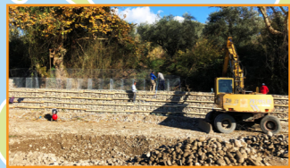
Αποκατάσταση αντιπλημμυρικών τεχνικών έργων Π.Ε. Αιτωλοακαρνανία