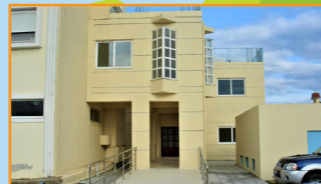
Προσθήκη κατ' επέκταση νέας πτέρυγας δυο ορόφων γενικού νοσοκομείου Μεσολογγίου «Χατζηκώστα»