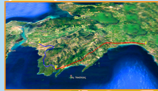
Συντήρηση και Βελτίωση Οδικού Άξονα Πογωνιάς - Πλαγιάς