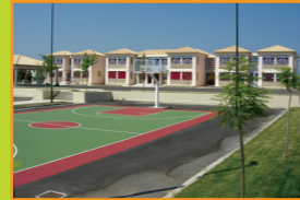
Ανέγερση Δημοτικού Σχολείου Λεπενού