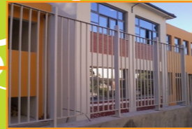
Ανέγερση 7 ου Δημοτικού Σχολείου Αργινίου