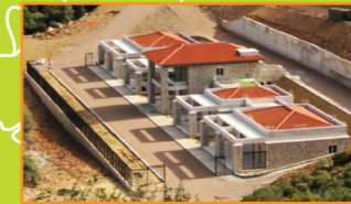
Στέγη υποστηριζόμενης διαβίωσης του συλλόγου «Αλκυόνη»