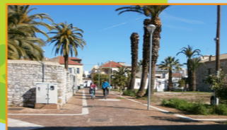
Ανάπλαση τμήματος Ιστορικού Κέντρου Ιεράς Πόλεως Μεσολογγίου, Π.Ε. Αιτωλοακαρνανία