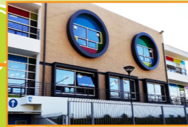
Κέντρο αποθεραπείας ΕΛΕΠΑΠ Αργινίου