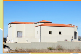
Εγκαταστάσεις επεξεργασίας λυμάτων Μενιδίου