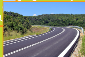
Ανακατασκευή δρόμου Κουβαρά - Φυτείες - Αστακός