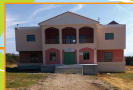
Ανέγερση στέγης υποστηριζόμενης διαβίωσης (ΣΥΔ) - Οικοτροφείου του εργαστηρίου «Παναγία Ελεούσα» στο Αργίνο