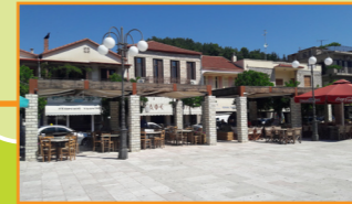
Αστική ανάπλαση Θέρμου