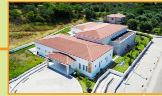
Μουσείο του αρχαιολογικού χώρου του Θέρμου Π.Ε. Αιτωλοακαρνανίας