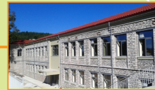
Αποκατάσταση στατικής επάρκειας του γυμνασίου Θέρμου