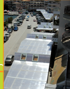
Αστική Ανάπλαση Αμφιλοχίας