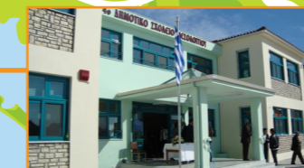
Ανέγερση 4 ου Δημοτικού σχολείου Μεσολογγίου